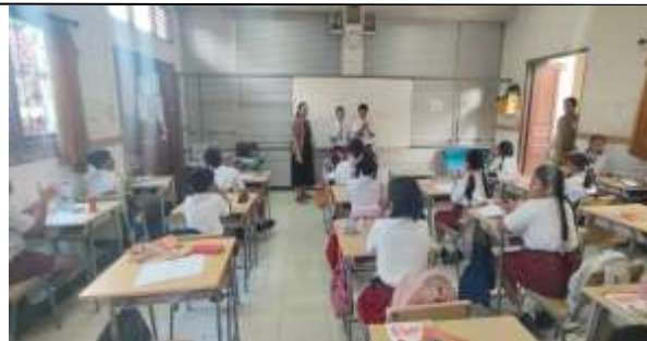
Gambar 3. Implementasi Punishment Edukatif Guru Memberikan Teguran Edukatif/Pembinaan Siswa

Temuan ini menunjukkan bahwa reward yang bersifat positif dan suportif mampu meningkatkan keterlibatan emosional siswa dalam proses belajar. Di sisi lain, penerapan punishment dalam penelitian ini juga terbukti efektif, namun dengan catatan bahwa punishment diberikan secara edukatif dan tidak represif. Hal ini sejalan dengan penelitian Roache & Lewis (2011) yang menyatakan bahwa kombinasi reward dan punishment yang diterapkan dalam konteks hubungan yang positif dapat meningkatkan tanggung jawab siswa dan mengurangi perilaku menyimpang. Sebaliknya, punishment yang bersifat agresif justru dapat memperburuk perilaku siswa.