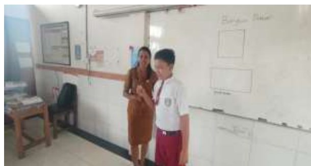
Gambar 2. Implementasi Reward dalam Pembelajaran Guru Memberikan Penghargaan Kepada Siswa

Hal ini menunjukkan bahwa reward dan punishment tidak hanya berdampak pada aspek kognitif, tetapi juga pada pembentukan kebiasaan ( habit formation ) dalam perilaku belajar siswa.