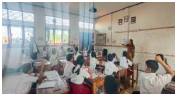
Gambar 4. Perubahan Kondisi Kelas Setelah Intervensi Kelas Lebih Tertib, Siswa Fokus Belajar (Dok. Peneliti, 31 Maret 2026)

yang humanis dalam pemberian punishment menjadi faktor kunci keberhasilan penelitian ini.