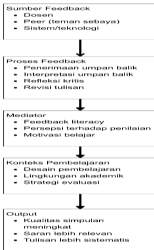
Gambar 2. Diagram Konseptual Balik Reflektif dalam Penulisan PTK

proses feedback yang berkelanjutan mampu membangun budaya reflektif dalam pembelajaran akademik. Mahasiswa yang terbiasa menerima dan menggunakan umpan balik secara kontinu menunjukkan kemampuan reflektif dan kualitas penulisan akademik yang lebih baik. Sudirman (2024) menjelaskan bahwa praktik reflektif dalam pendidikan tinggi berkontribusi terhadap peningkatan kemampuan berpikir kritis mahasiswa. Kemampuan reflektif tersebut menjadi dasar penting dalam penyusunan simpulan dan saran yang lebih logis, sistematis, dan sesuai dengan hasil penelitian.