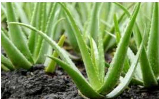
Gambar 2. Lidah Buaya

Penelitian (Widyasanti et al., 2017) mengonfirmasi bahwa ekstrak Lerak memiliki kemampuan berbusa dan membersihkan yang dapat diaplikasikan sebagai bahan dasar sabun cair. Saponin dari Lerak bekerja dengan menurunkan tegangan permukaan air. Karakteristik ini memungkinkan Lerak mengangkat kotoran dan minyak dari kulit, mirip dengan cara kerja deterjen sintetis namun dengan biodegradabilitas yang lebih baik (ramah lingkungan) (Nurrosyidah et al., 2023) Selain membersihkan, ekstrak Lerak terbukti memiliki aktivitas antibakteri terhadap Staphylococcus aureus dan Escherichia coli , menjadikannya kandidat ideal untuk sabun cuci tangan antiseptik alami (Oktaviani et al., 2024) Meskipun efektif, penggunaan surfaktan alami konsentrasi tinggi tanpa moisturizer dapat menyebabkan kulit terasa kesat dan kering. Oleh karena itu, formulasi sabun lerak memerlukan penambahan humektan (pelembap) (Cavaletti et al., 2023). Namun salah satu tantangan sabun berbasis lerak adalah aroma alaminya yang menjadikan kurang menarik yaitu sedikit asam/langu. (Utami, et al, 2021). Keterbatasan aroma ini menjadikan sabun alami dengan aroma lerak kurang diminati di komersial.