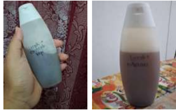
Gambar 5. Sabun cuci tangan dengan biosurfaktan lerak ( sapodium rarak ), aditif lidah buaya dengan essential oil kopi dan melati.

Untuk meningkatkan manfaat fungsional, sabun alami ini dikombinasikan dengan gel lidah buaya yang kaya akan senyawa anti-inflamasi dan pelembap alami seperti aloin dan polisakarida (Meutia et al., 2024). Aloe vera juga terbukti mampu mempercepat regenerasi kulit berdasarkan penelitian (Sinaga et al., 2023) dalam Jurnal Farmasi & Sains Indonesia melaporkan bahwa lidah buaya ( Aloe vera ) mengandung berbagai senyawa bioaktif, seperti flavonoid, glikosida, tanin, saponin, dan steroid, serta asam amino yang berperan dalam mempercepat proses regenerasi kulit. Temuan tersebut menunjukkan bahwa penambahan lidah buaya ke dalam formulasi sabun tidak hanya berfungsi sebagai bahan pendukung untuk menjaga kelembapan kulit, tetapi juga membantu merawat kulit agar tetap lembap, tidak mudah kering, dan tampak lebih sehat. dalam Heliyon (open-access). Kandungan ini menjadikan produk sabun tidak hanya membersihkan tetapi juga merawat kulit agar tetap lembap, tidak kering, dan lebih sehat.