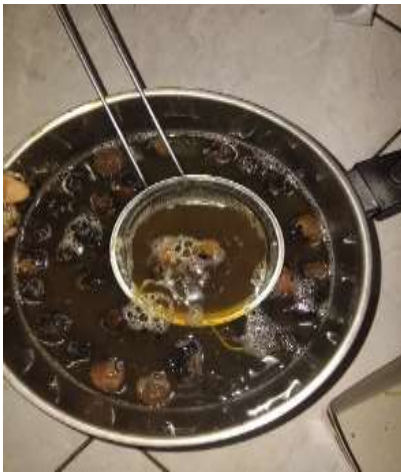
Gambar 4. Proses Pembuatan Sabun Cair Berbahan Dasar Lerak

oleh mikroba. Ekstrak yang telah stabil kemudian diformulasikan dengan bahan dasar sabun lainnya. Berdasarkan hasil uji iritasi manual terhadap kulit, penggunaan lerak sebagai bahan aktif sabun pada kulit normal menunjukkan hasil yang aman dan tidak menimbulkan reaksi iritasi (eritema atau edema), sehingga layak digunakan sebagai alternatif pembersih alami yang ramah lingkungan. Seperti yang dikemukakan (Oktaviani et al., 2024) lerak aman dimanfaatkan sebagai detergen ataupun sabun cuci tangan yang ramah lingkungan dan aman bagi kesehatan.