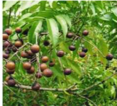
Gambar 1. Buah Lerak

merusak barier kulit ( skin barrier ), meningkatkan Transepidermal Water Loss (TEWL), dan memicu dermatitis kontak iritan, terutama pada penggunaan berulang (Asda & Sekarwati, 2022). Sabun dengan komposisi alami sudah banyak dikembangkan dan dipasarkan di berbagai komersial. Bahan alami yang bisa dibuat sabun salah satunya adalah lerak.