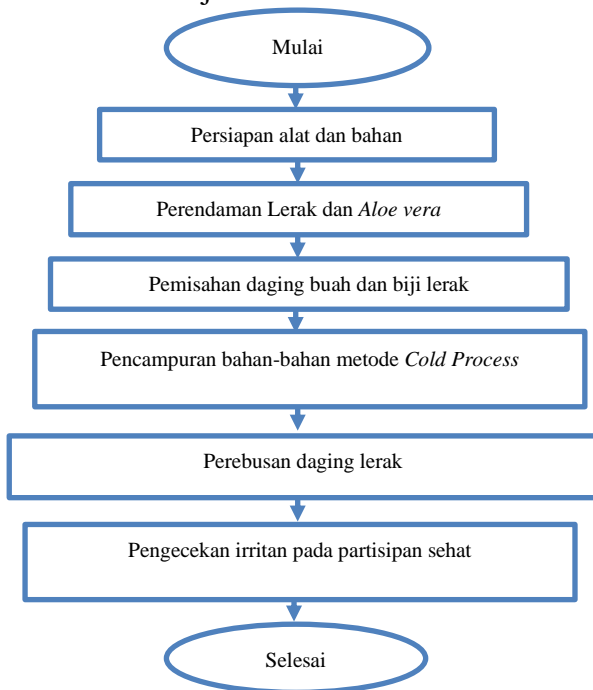
Gambar 3. Skema proses pembuatan sabun alami dari lerak dan aloe vera

Menurut (Siswadi & Syaifuddin, 2024) Tahap Perancangan yang dilakukan membuat skema proses pembuatan sabun cuci tangan dari bahan lerak, aloe vera, dengan essential oil kopi dan melati disajikan dalam Gambar 3.